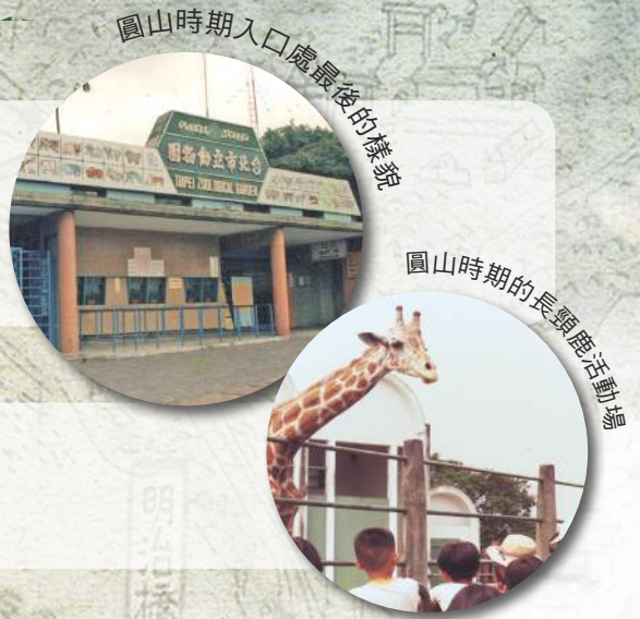
圓山時期入口處最後的樣貌

西元1884年清廷於大稻埕與艋舺兩地之間構築城廓， 「臺北」這一名詞在臺北建城後，成為臺北市的通稱。 今年適逢臺北建城（ ）周年。